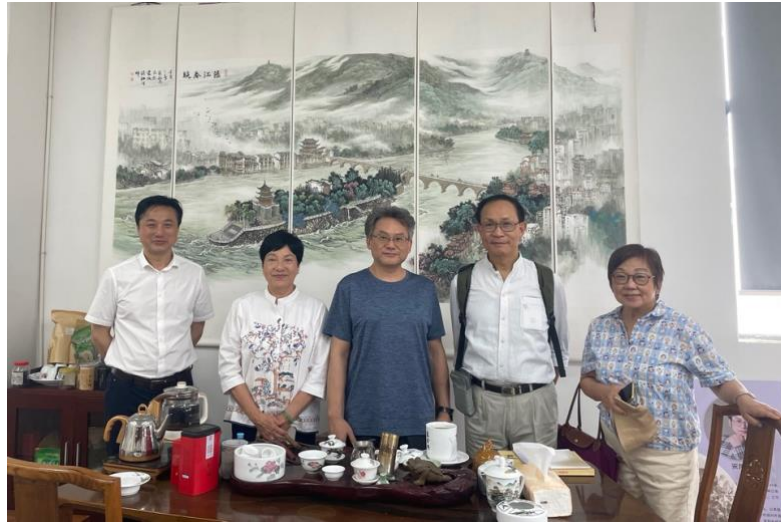
與中國著名陶瓷藝術大師宋龍飛先生在其大作前合影。