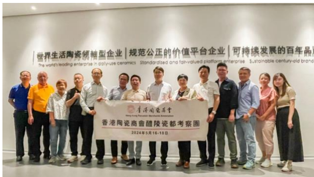
香港陶瓷商會代表團與醴陵市人民政府劉新華市長（左8）交流後合影