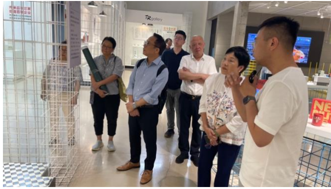
文禮先生（右一），陶潤會創始人，介紹其「傳承百年世家」的企業。