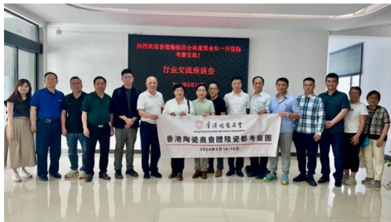
香港陶瓷商會——湖南省陶瓷行業協會，行業交流座談會會後合影。