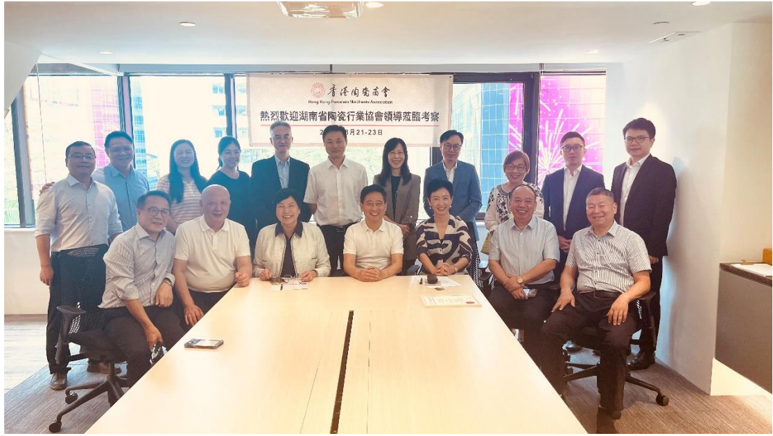
(交流会议后大合照)